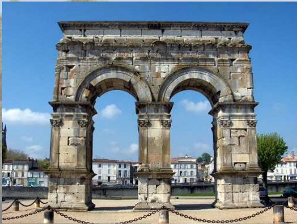
un arc de triomphe