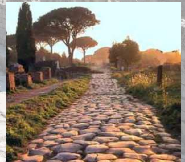
une route pavée